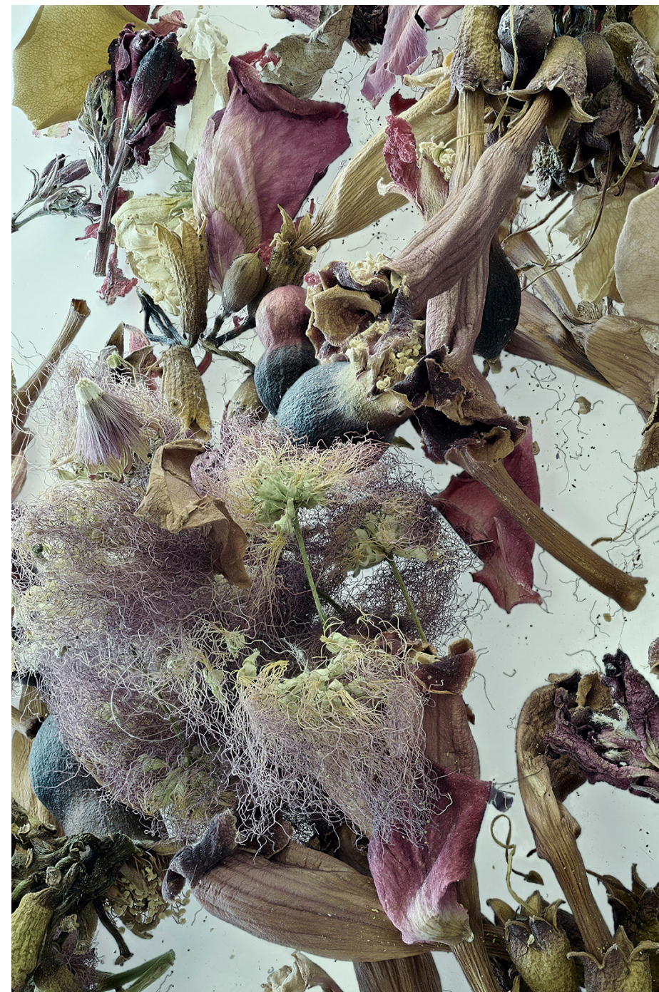
Vuelos secretos (127) , fotografía, 2025.

“Esta imagen pertenece a mi serie fotográfica en curso, titulada Vuelos secretos de las plantas . Propone situarnos en un mundo singular, donde el reino vegetal abandona su aparente pasividad para convertirse en agente de una dinámica propia, lanzándose a volar como los pájaros o las brujas. La energía de la naturaleza se despliega en un movimiento ascendente que recuerda la búsqueda vegetal de la luz, creando escenarios oníricos en los que perderse, secretamente o no.”